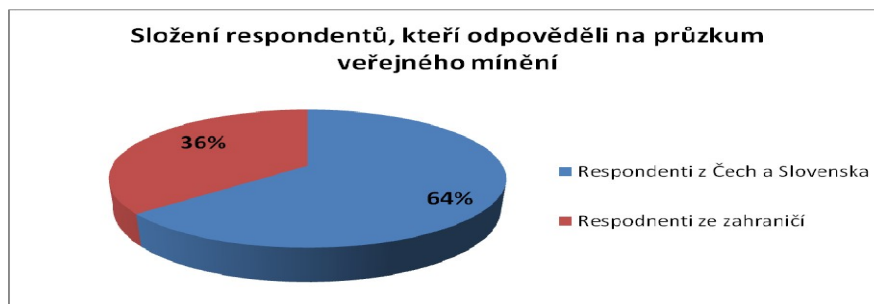
Graf 1: Složení respondentů, kteří odpověděli na průzkum veřejného mínění

vzdělávacích institucí, ale i značná většina z komerční sféry. Zahraniční respondenti jsou pouze z univerzitního prostředí.