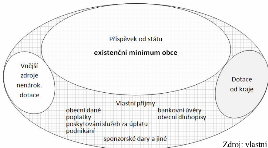
Obr. 2 – Zdroje financování obcí

Jedná se především o nenárokové dotace od státu (zreduované), krajů, EU nebo z jiných fondů (EHP, bilaterální apod.), které budou asi ještě určitou dobu k dispozici obcím. Patří sem také dary, spoluúčasti partnerů na společných projektech apod.